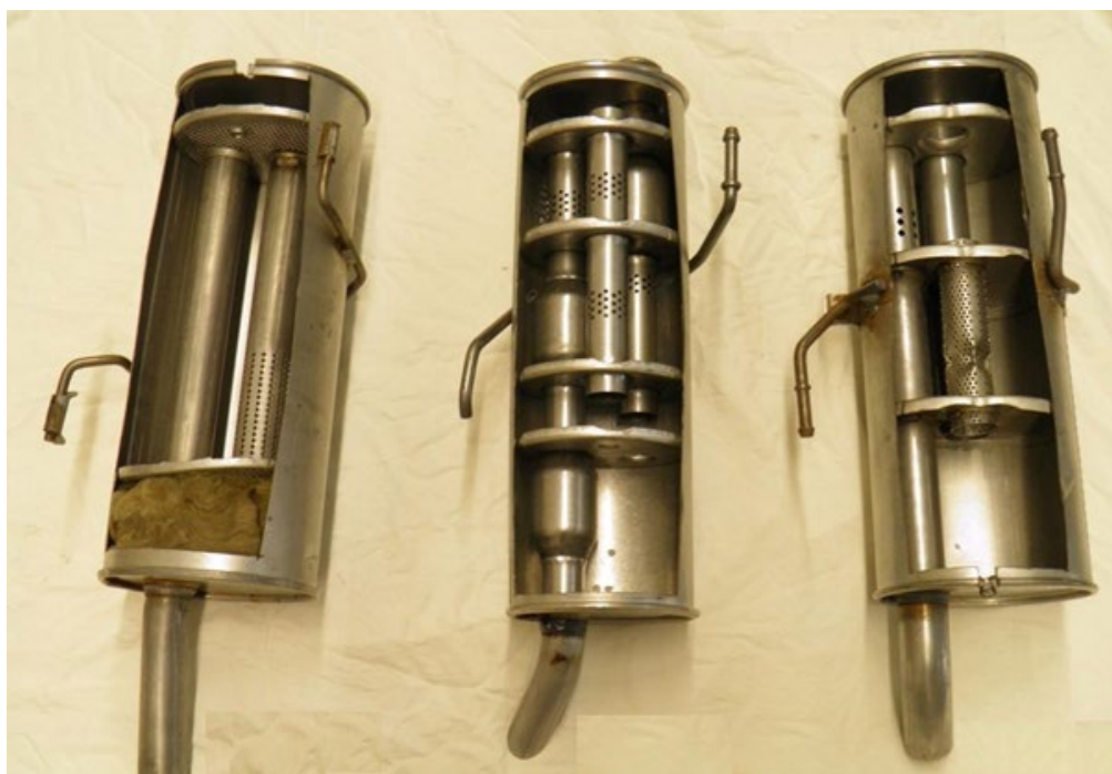
Peugeot 206 – zadní díl. I zde je patrné šetření u konkurentů (MTS uprostřed). Navíc na vzorku vlevo lze vidět pro OE zakázanou minerální vatu.