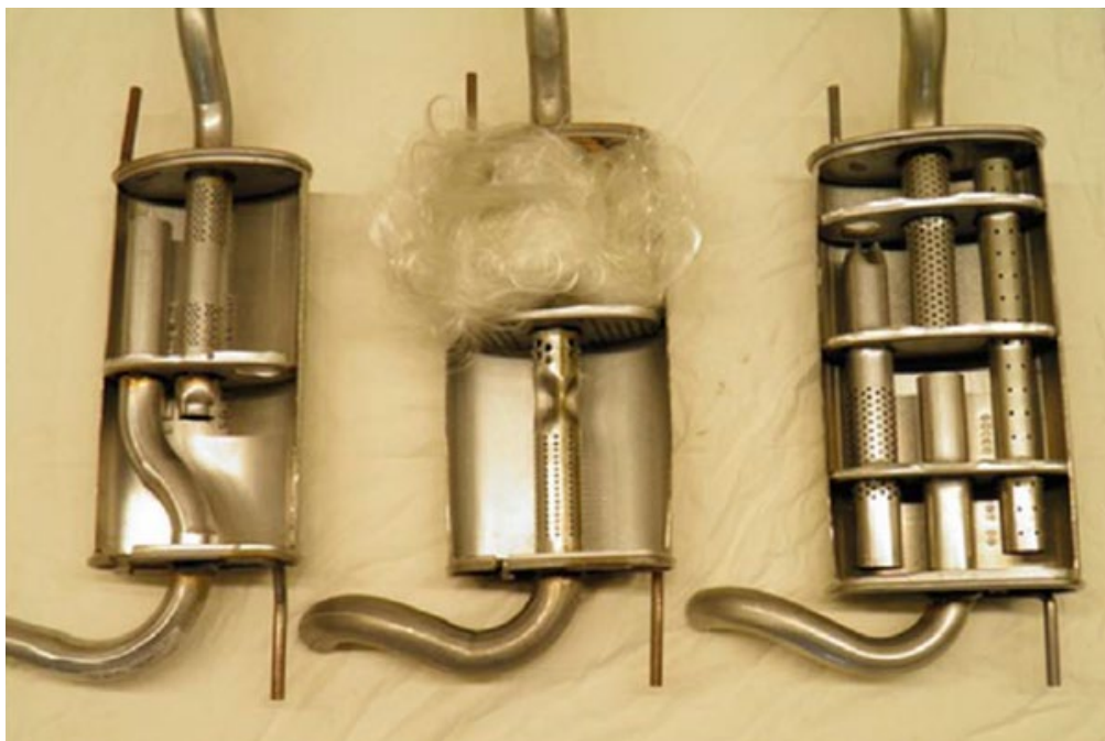
VW Polo 2001 a zadní díl od MTS (zcela vpravo) a největší prémioví konkurenti. Zde je jasně vidět, jak se dá ušetřit na nákladech na výrobu. Ovšem dostáváte za svoje peníze opravdu to co chcete?