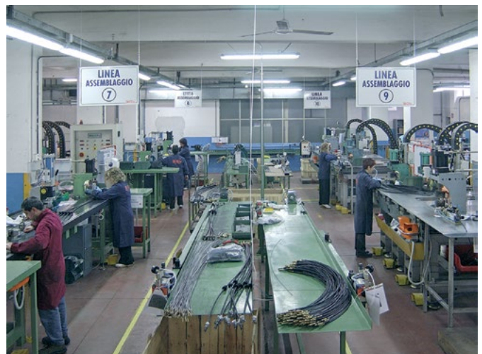
Jedna z mnoha kompletačních linek