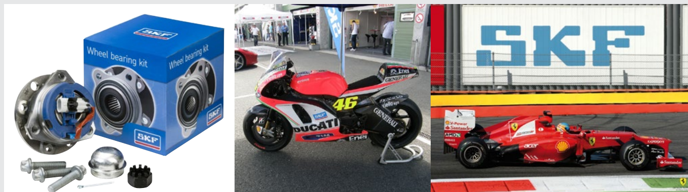
SKF ložiska najdete i mezi těmi nejlepšími na závodních tratích