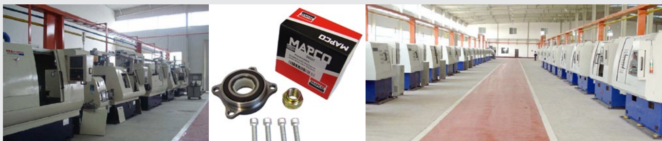
Automatická CNC výroba MAPCO